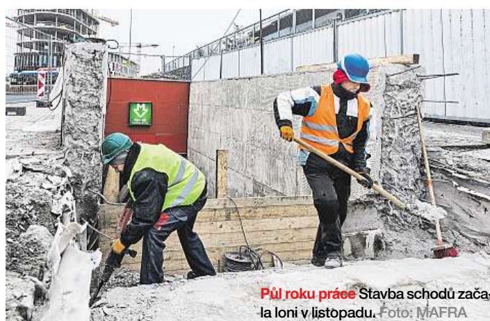
Půl roku práce Stavba schodů začala loni v listopadu.

Město řešilo v minulosti kromě eskalátoru další varianty. Jednou